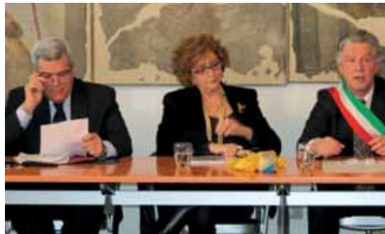
Questore, Prefetto, Sindaco

L'occasione mi è gradita per porgerLe i più cordiali saluti.