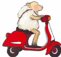
Il regalo / di S. Van Ommen

Incrivendosi alla biblioteca e sottoscrivendo il regolamento internet, è possibile accedere alla postazione per utenti e navigare gratuitamente fino ad 1 ora per volta e fino ad un massimo di 3 ore settimanali. Per l'iscrizione di minori è richiesta l'autorizzazione dei genitori o di chi ne fa le veci.