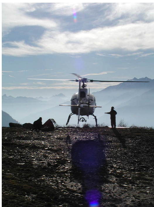
Illustrazione dell'Attività AIB 2008/2009 e Documento programmatico per il 2009/2010