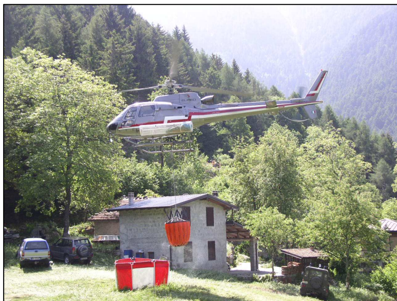
Illustrazione dell'Attività A.I.B. 2013/2014 e Documento programmatico per il 2014/2015